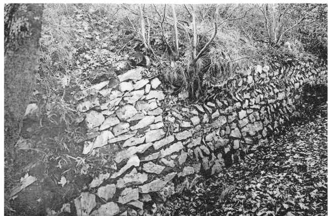
1920 - Vue de la muraille au-dessus de la Porte de Rome